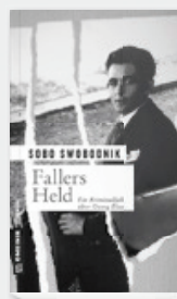
ISBN 978-3-8392-1802-0 11,99 €