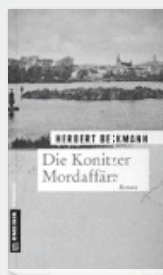
ISBN 978-3-8392-1801-3 9,99 €

GMEINER-Krimis: Lebendige Zeitgeschichte