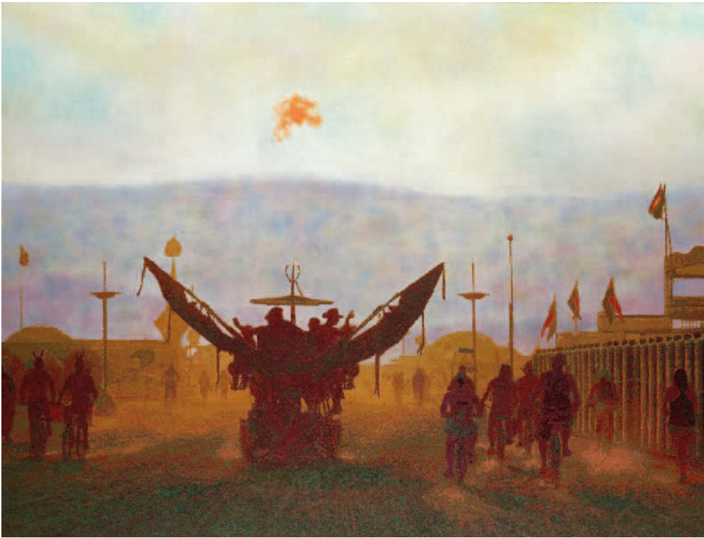
Römer + Römer, 7:30 between GlamCocks and Contraptionists , 2018, Öl, Acryl auf Lwd., 230 × 300 cm, Foto: Eric Tschernow