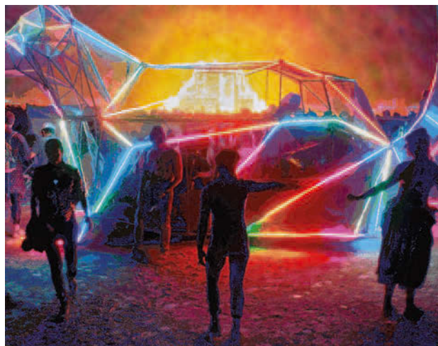
Römer + Römer, Black Rock Bandits Raccoon , 2018, Öl, Acryl auf Lwd, 230 x 300 cm

Die Römers besuchten Burning Man 2017 und hielten ihre Eindrücke in vielen digitalen Fotografien fest. Eine Auswahl an ausdrucksstarken Szenen wurde im Computer weiterverarbeitet, bis die digitale Vorlage anschließend mit Öl und Acryl in die häufig großformative Malerei übertragen werden kann.